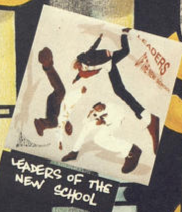
LEADERS OF THE NEW SCHOOL

Voici, d'après moi, les meilleurs albums de Rap de cette année, et, sur la centaine qui sont sortis en 91, le choix fut difficile. Je ne les ai pas classés par ordre de préférence car je n'en ai pas. Ils ont juste été pour moi les meilleurs albums au moment de leur sortie et ont marqué une période, un style, un nouveau pas dans l'évolution du Rap.