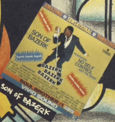
SON OF BAZERK

Plutôt que de décrire chacun de ces albums, le mieux est encore de vous laisser les découvrir par vous même.